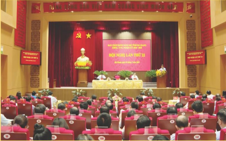
Hội nghị lần thứ 22 Ban Chấp hành Đảng bộ tỉnh khóa XVII.