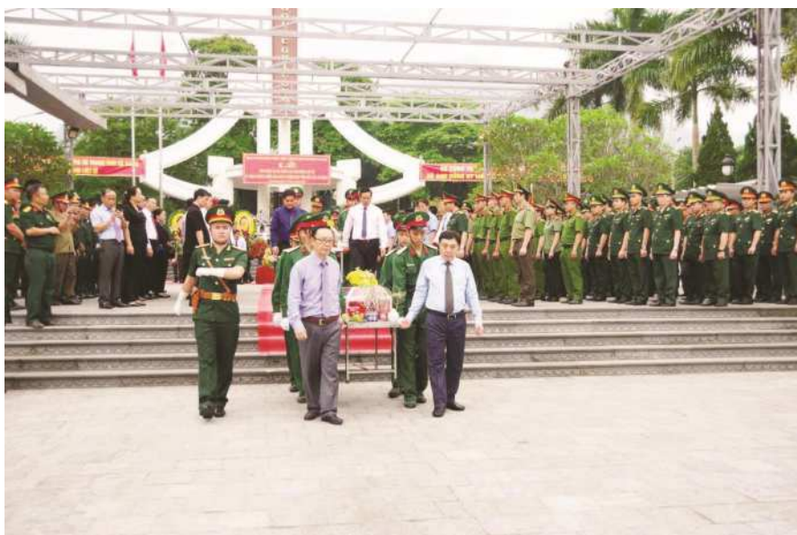
Lễ truy điệu và an táng 09 hài cốt Liệt sỹ tại Nghĩa trang Liệt sỹ Vị Xuyên ngày 17/4/2024

các ngày Tết, lễ lớn của đất nước, của dân tộc, đặc biệt là ngày Thương binh - Liệt sỹ 27/7, các cấp, ngành, tổ chức, cơ quan, đơn vị đã tổ chức thăm hỏi, động viên, tặng quà các đối tượng chính sách, người có công với cách mạng và thân nhân người có công. Phong trào xây dựng Quỹ “ Dền ơn đáp nghĩa ” không ngừng được nâng cao, được xã hội hóa một cách rộng rãi và đạt kết quả khá tốt, kịp thời giúp đỡ, động viên các gia đình chính sách có hoàn cảnh khó khăn vươn lên. Hiện nay, tình chi trả chế độ trợ cấp thường xuyên hàng tháng trên 2.834 người có công và thân nhân; 98,9% gia đình chính sách có mức sống bằng hoặc khá hơn mức sống trung bình của dân cư nơi cư trú. Công tác thanh tra, kiểm tra việc thực hiện chính sách đối với người có công và thân nhân của người có công được thực hiện thường xuyên.