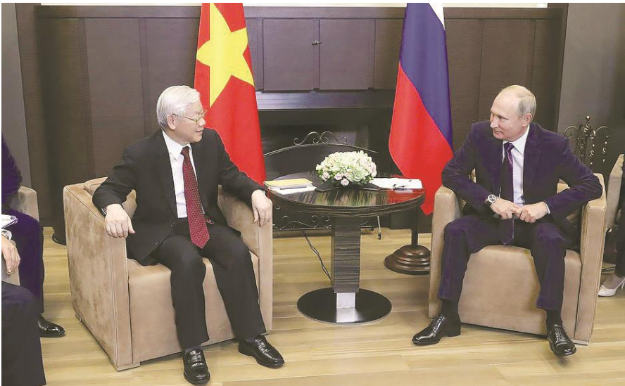
Tổng Bí thư Nguyễn Phú Trọng tiếp Tổng thống Vladimir Putin thăm cấp Nhà nước tới Việt Nam

Trong các ngày từ 19/6- 20/6, nhận lời mời của Tổng Bí thư Nguyễn Phú Trọng, Tổng thống Liên bang Nga Vladimir Putin đang có chuyến thăm cấp Nhà nước tới Việt Nam. Chuyến thăm được truyền thông quốc tế đánh giá tích cực khi cho rằng sự kiện này sẽ tạo xung lực mới thúc đẩy quan hệ Đối tác chiến lược toàn diện giữa hai nước Việt Nam - Nga.