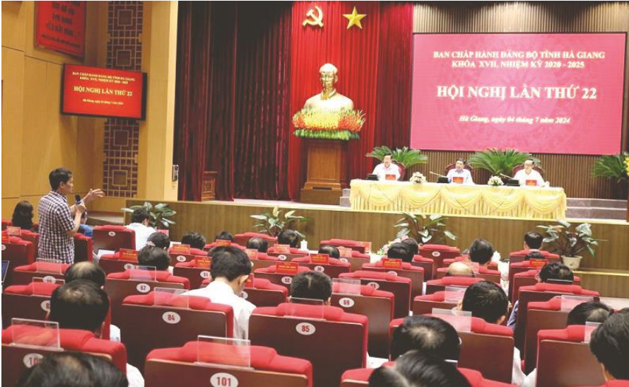
Các đại biểu thảo luận tại Hội trường

đúng quy định. Công tác khám, chữa bệnh, chăm sóc nâng cao sức khỏe nhân dân được nâng cao. Giá trị văn hóa truyền thống được bảo tồn và phát huy. Công tác an sinh xã hội được quan tâm. Hoạt động đối ngoại được tăng cường. Tình hình an ninh chính trị, trật tự an toàn xã hội được đảm bảo, biên giới ổn định.