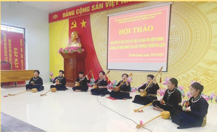
Các nghệ nhân biểu diễn hát then tại Hội thảo bảo tồn và phát huy giá trị truyền thống lầu then Bjoóc Mạ gắn với phát triển du lịch tại thành phố Hà Giang.