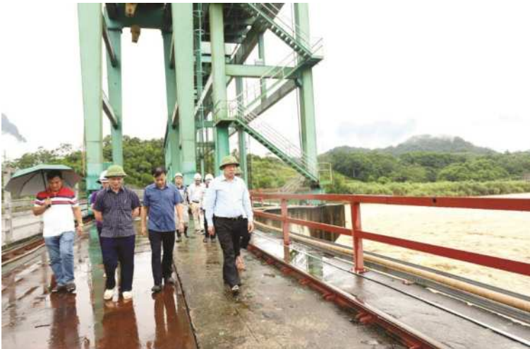
Đoàn công tác của tỉnh kiểm tra việc xả lũ tại công trình đập thủy điện Sông Lô 6.