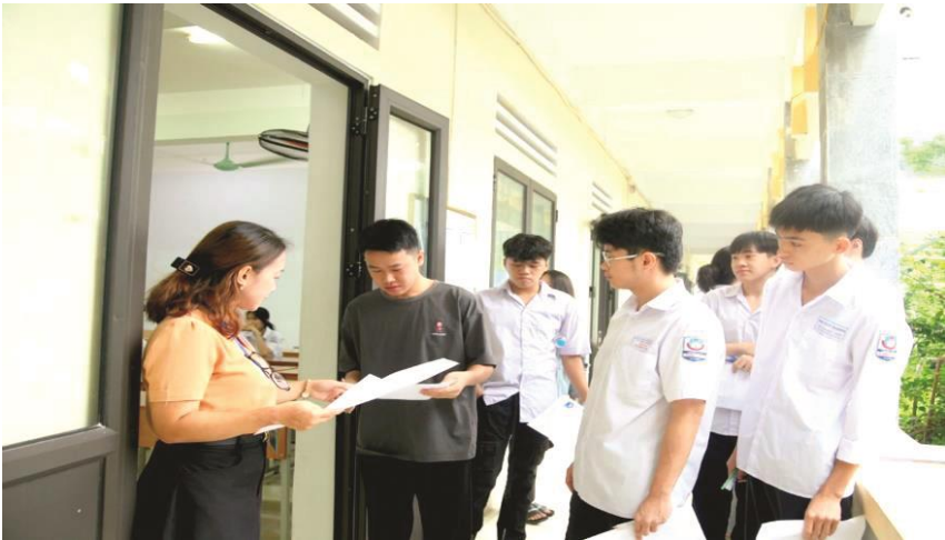
Thí sinh kiểm tra thông tin trước khi vào phòng thi.

Theo báo cáo của Ban Chỉ đạo thi cấp tỉnh, đề thi năm nay nằm cơ bản trong chương trình THPT, bám sát chuẩn kiến thức kỹ năng, đề thi vừa sức, tương đương với đề thi minh họa, các nội dung khó tập trung ở phần cuối của đề. Dự kiến, thời gian công bố kết quả thi tốt nghiệp THPT vào ngày 17/7, thời gian phúc khảo kéo dài 10 ngày sau đó. Thí sinh xem kết quả tốt nghiệp, nhận Giấy chứng nhận tốt nghiệp tạm thời từ 21 - 23/7.