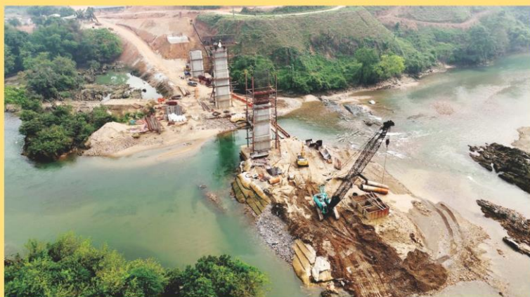
Đồn sức thi công tuyến cao tốc Tuyên Quang - Hà Giang Nhà thầu huy động máy móc thi công cầu qua sông đoạn xã Tân Quang (Bắc Quang).