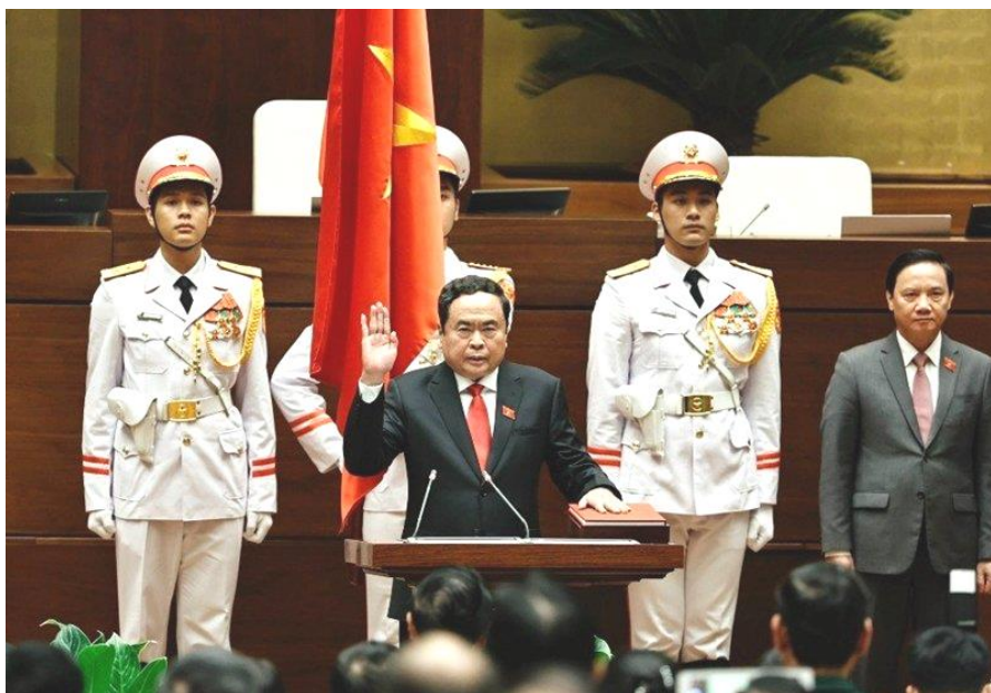
Chủ tịch Quốc hội Trần Thanh Mẫn tuyên thệ nhậm chức

* Chiều 20/5, tại Kỳ họp thứ 7, Quốc hội khóa XV đã bầu đồng chí Trần Thanh Mẫn, Ủy viên Bộ Chính trị, Phó Chủ tịch Thường trực Quốc hội, đại biểu Quốc hội khoá XV giữ chức Chủ tịch Quốc hội nước Cộng hoà xã hội chủ nghĩa Việt Nam nhiệm kỳ 2021-2026. Ngay sau đó, trước sự chứng kiến của Quốc hội, Chủ tịch Quốc hội Trần Thanh Mẫn tuyên thệ: “Dưới cờ đỏ sao vàng thiêng liêng của Tổ quốc, trước Quốc hội và đồng bào cử tri cả nước, Tôi - Chủ tịch Quốc hội nước Cộng hoà xã hội chủ nghĩa Việt Nam xin tuyên thệ: Tuyệt đối trung thành với Tổ quốc, với Nhân dân, với Hiến pháp nước Cộng hoà xã hội chủ nghĩa Việt Nam; nỗ lực phấn đấu, hoàn thành tốt nhiệm vụ được Đảng, Nhà nước và Nhân dân giao phó”.