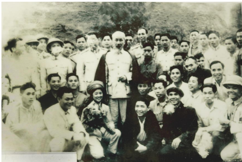
Cán bộ, nhân dân Hà Giang chụp ảnh với Bác Hồ sáng ngày 27.3 tại khu vực Cầu Mè, thị xã Hà Giang

Trời có bốn mùa: Xuân, Hạ, Thu, Đông. Đất có bốn phương: Đông, Tây, Nam, Bắc. Người có bốn đức: Cần, Kiệm, Liêm, Chính. Thiếu một mùa thì không thành trời. Thiếu một phương thì không thành đất. Thiếu một đức thì không thành người.