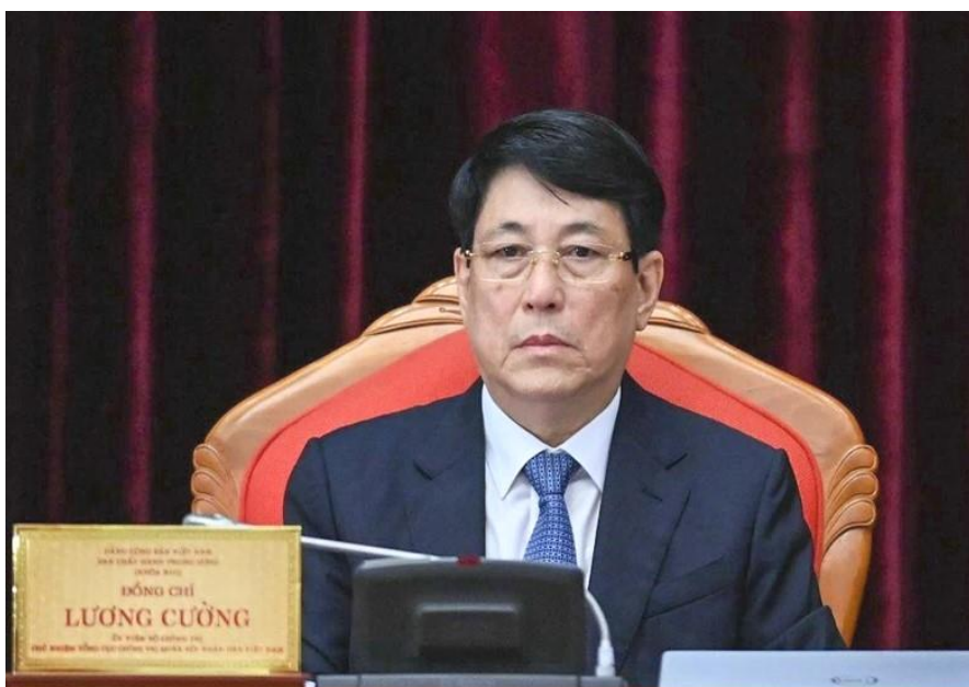
Đồng chí Lương Cường, Thường trực Ban Bí thư

* Ngày 16/5, trước khi Hội nghị lần thứ chín Ban Chấp hành Trung ương Đảng khóa XIII khai mạc, Bộ Chính trị báo cáo Ban Chấp hành Trung ương Đảng về việc Bộ Chính trị đã quyết định phân công đồng chí Đại tướng Lương Cường, Ủy viên Bộ Chính trị, Chủ nhiệm Tổng cục Chính trị Quân đội nhân dân Việt Nam tham gia Ban Bí thư và giữ chức vụ Thường trực Ban Bí thư; đồng chí Lê Minh Hưng, Bí thư Trung ương Đảng, Chánh Văn phòng Trung ương Đảng giữ chức vụ Trưởng Ban Tổ chức Trung ương, Chánh Văn phòng Trung ương Đảng.