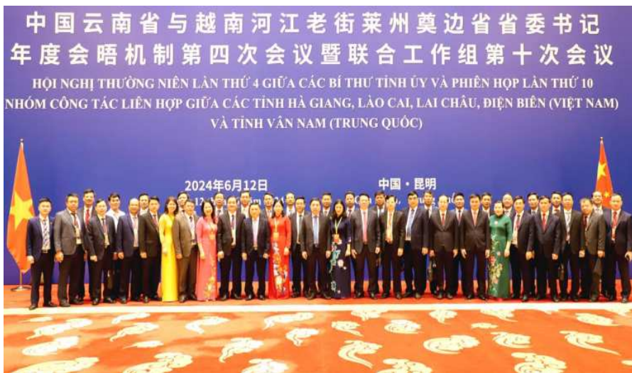
Đoàn đại biểu Tỉnh Hà Giang tại Hội nghị thường niên lần thứ 4 giữa Bí thư Tỉnh ủy các tỉnh Lào Cai, Điện Biên, Lai Châu, Hà Giang (Việt Nam) và Bí thư Tỉnh ủy Vân Nam (Trung Quốc).

Trong thời gian làm việc, đoàn đại biểu các tỉnh biên giới Việt Nam đã tham dự Hội nghị thường niên lần thứ 4 giữa Bí thư Tỉnh ủy 4 tỉnh của Việt Nam và Bí thư Tỉnh ủy Vân Nam (Trung Quốc); phiên họp lần thứ 10 Nhóm công tác liên hợp giữa các tỉnh Lào Cai, Điện Biên, Lai Châu, Hà Giang (Việt Nam) và tỉnh Vân Nam (Trung Quốc). Các bên đã tập trung trao đổi, đánh giá kết quả triển khai Biên bản Hội nghị thường niên lần thứ 3 giữa Bí thư Tỉnh ủy 04 tỉnh Việt Nam và Bí thư Tỉnh ủy Vân Nam (Trung Quốc); thống nhất ký kết “Biên bản Hội nghị thường niên lần thứ Tư giữa Bí thư Tỉnh ủy các tỉnh Hà Giang, Lào Cai, Lai Châu, Điện Biên (Việt Nam) và Bí thư Tỉnh ủy Vân Nam (Trung Quốc)”.