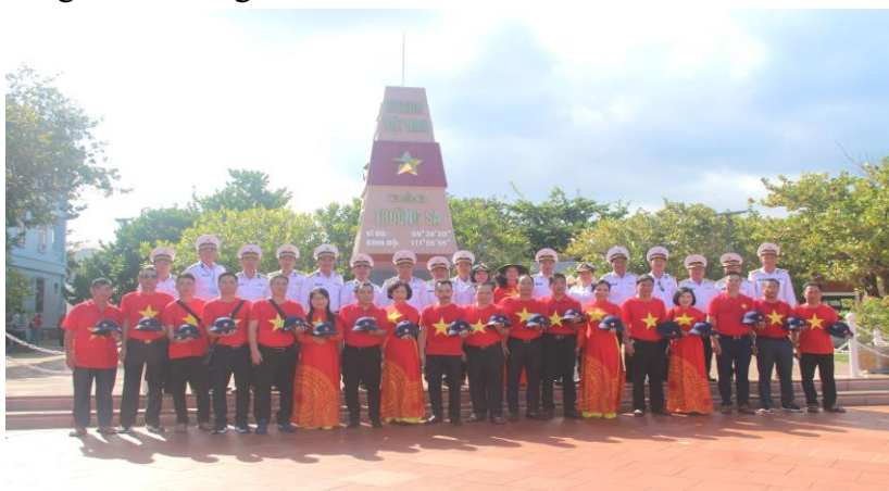
Đoàn công tác tỉnh Hà Giang chụp ảnh lưu niệm tại Trường Sa.

Từ ngày 12/5 đến ngày 20/5, Đoàn công tác số 20 do Bộ tư lệnh quân chủng Hải Quân Việt Nam tổ chức với 232 đại biểu gồm tỉnh Hà Giang, Ngân Hàng Nhà nước Việt Nam, Ngân hàng chính sách xã hội Việt Nam, Hiệp hội Ngân hàng Việt Nam, Công ty Cổ phần tiêu dùng Masan, Nhà hát chèo Việt Nam... đi thăm, tặng quà, động viên cán bộ, chiến sỹ, Nhân dân trên quần đảo Trường Sa và nhà giàn DK1.