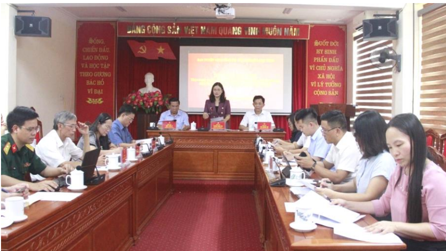
Hình ảnh tại điểm cầu tỉnh