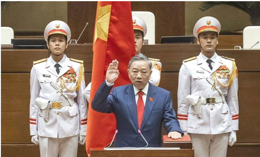
Chủ tịch nước Tô Lâm tuyên thệ nhậm chức.

Đúng 9h sáng, tại Phòng họp Diên Hồng, Nhà Quốc hội, Chủ tịch nước Tô Lâm đã thực hiện nghi lễ tuyên thệ nhậm chức và tuyên thệ: “Dưới cờ đỏ sao vàng thiêng liêng của Tổ quốc, trước Quốc hội và đồng bào cử tri cả nước, tôi, Chủ tịch nước Cộng hòa xã hội chủ nghĩa Việt Nam xin tuyên thệ: Tuyệt đối trung thành với Tổ quốc, với Nhân dân, với Hiến pháp nước Cộng hòa xã hội chủ nghĩa Việt Nam, nỗ lực phấn đấu hoàn thành tốt nhiệm vụ được Đảng, Nhà nước và Nhân dân giao phó”.