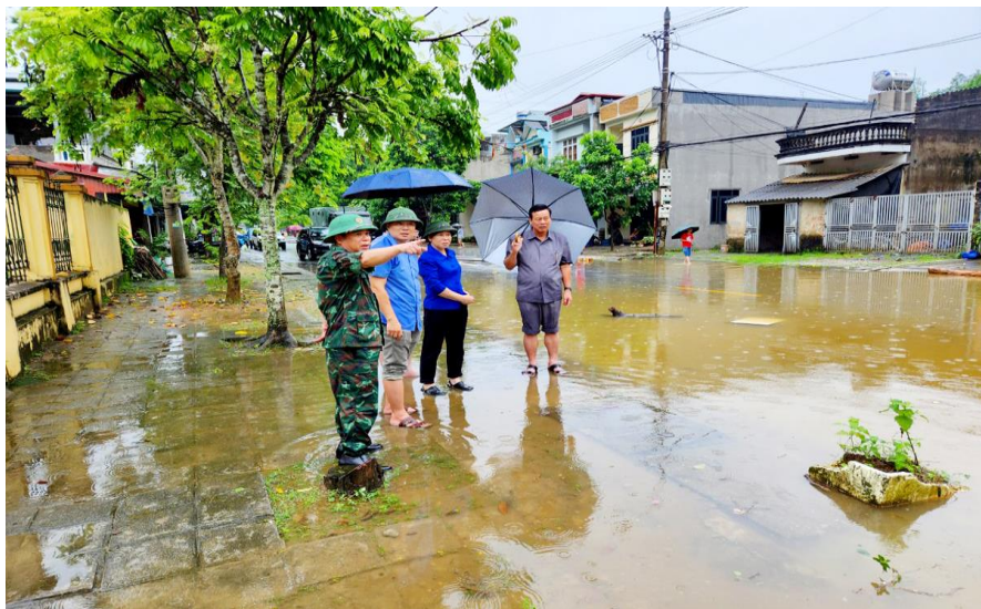
Chủ tịch Ủy ban nhân dân tỉnh kiểm tra tình trạng ngập úng tại một số điểm trên địa bàn thành phố Hà Giang.

quan chức năng, có 03 người tử vong (2 người ở Hoàng Su Phì, 1 người ở Quản Bạ), trên 1.400 ngôi nhà bị ảnh hưởng (3 nhà bị sập hoàn toàn), hơn 278 ha lúa, rau màu bị thiệt hại, 28,7 ha ao cá bị tràn bờ, hàng nghìn gia súc, gia cầm bị cuốn trôi, 281 xe máy và 91 ô tô bị ngập nước, hàng chục nghìn m 3 đất, đá sạt lở trên các tuyến đường. Tổng thiệt hại ước tính 61 tỷ đồng.