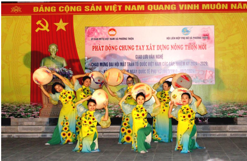
Ảnh: Xã Phương Thiện phát động chung tay xây dựng nông thôn mới

trình xây dựng nông thôn mới đã giúp cho bộ mặt nông thôn của tỉnh có nhiều khởi sắc. Đến hết năm 2021, toàn tỉnh có 01 đơn vị được Thủ tướng Chính phủ công nhận hoàn thành nhiệm vụ xây dựng nông thôn mới (thành phố Hà Giang); 47/175 xã đạt chuẩn nông thôn mới, trong đó có 01 xã đạt chuẩn nông thôn mới nâng cao (xã Phương Thiện, thành phố Hà Giang).