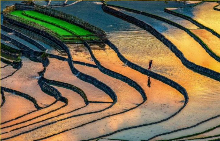
Mùa nước đổ