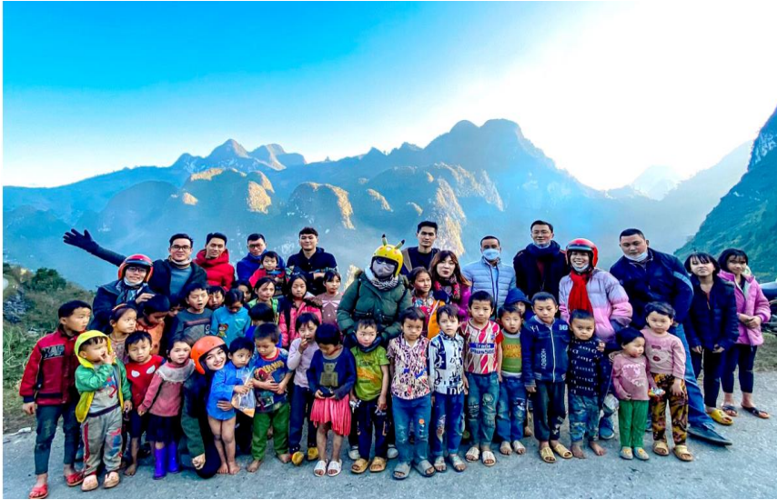
Khách du lịch chụp ảnh lưu niệm cùng các cháu nhỏ trên Cao nguyên đá.

phương, sở, ban, ngành đặc biệt quan tâm, phối hợp chặt chẽ thực hiện.