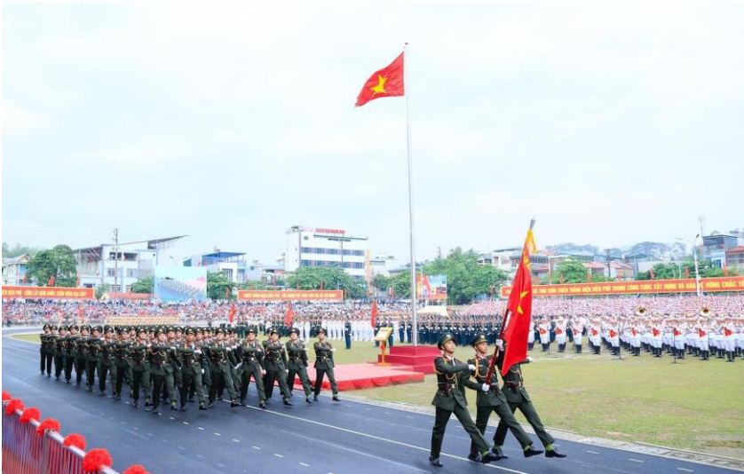
Lực lượng diễu binh với 12.000 người tái hiện khí thế của chiến thắng "lùng lẫy năm châu, chấn động địa cầu" 70 năm trước

lãnh đạo, nguyên lãnh đạo Đảng, Nhà nước, Mặt trận Tổ quốc Việt Nam, các ban, bộ, ngành, đoàn thể Trung ương, các tỉnh, thành phố và đại biểu tỉnh Điện Biên. Buổi lễ còn có sự tham dự của nhiều đại biểu quốc tế, phóng viên báo chí nước ngoài.