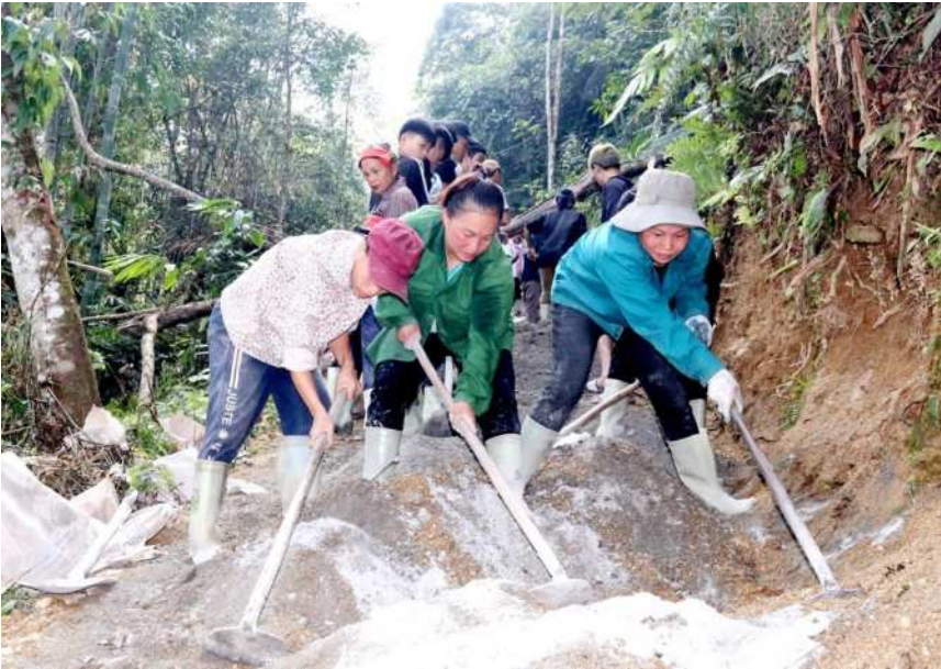
Đảng viên và nhân dân thôn Nà Thác, xã Phương Độ chung sức làm đường bê tông lên vùng chè Shan tuyết.

Bên cạnh đó, công tác kết nạp đảng viên được quan tâm, chú trọng về tiêu chuẩn, chất lượng gắn với rà soát, sàng lọc đưa đảng viên không còn đủ tư cách ra khỏi Đảng. Tính đến ngày 12/3/2024, tổng số đảng viên toàn tỉnh là 74.667 đồng chí. Công tác kiểm tra tổ chức đảng, đảng viên được thực hiện thường xuyên, đảm bảo siết chặt kỷ cương, kỷ luật của Đảng.