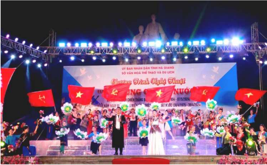
Chương trình nghệ thuật thu hút đông đảo du khách

Trong thời gian tới, Hà Giang sẽ tiếp tục đẩy mạnh công tác tuyên truyền quảng bá, hình ảnh con người, thương hiệu du lịch cũng như không ngừng chú trọng, tăng cường, nâng cao chất lượng dịch vụ du lịch du lịch khi đến với Hà Giang.