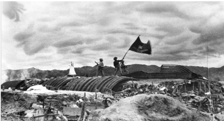
Lá cờ "Quyết chiến quyết thắng" đang phấp phới bay trên nóc hầm Tướng De Castries.

Chiến thắng Điện Biên Phủ là biểu tượng của lòng quả cảm vô song và là ngôi sao sáng của phong trào giải phóng dân tộc, báo hiệu sự sụp đổ của chủ nghĩa thực dân trên thế giới.