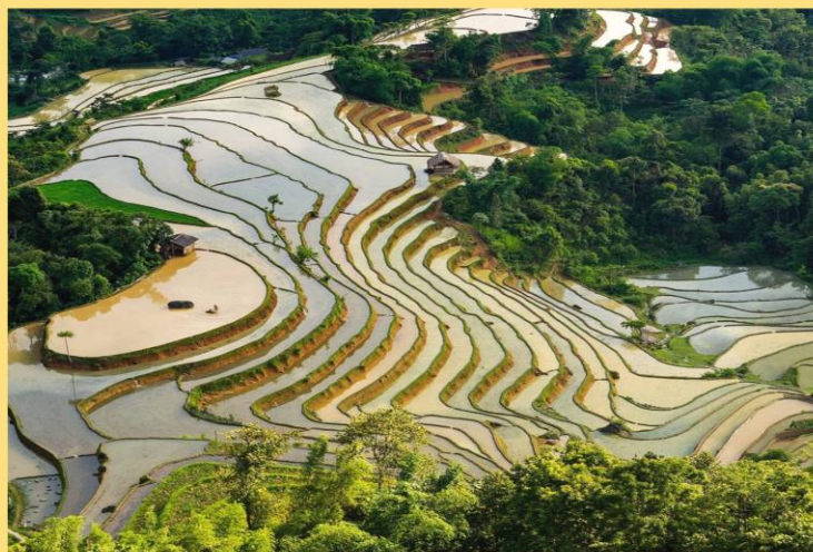
Mùa nước đổ.