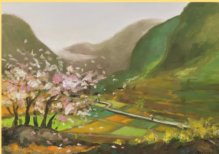
Mùa Xuân Hà Giang. Tranh: Hồ Sĩ Đức