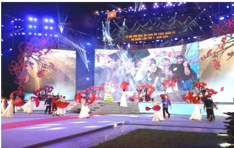
Màn hát múa tại Lễ hội văn hóa, du lịch và ẩm thực quốc tế lần thứ nhất, năm 2024

Từ ngày 29/3/2024 - 31/3/2024, tại Thành phố Hà Giang, tỉnh Hà Giang đã tổ chức khai mạc Lễ hội văn hóa, du lịch và ẩm thực quốc tế lần thứ nhất, năm 2024.