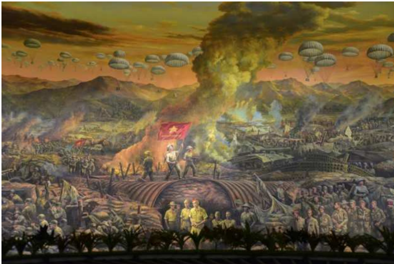
Ảnh: Trường đoạn 4 “Chiến thắng Điện Biên” của bức tranh Panorama tái hiện toàn cảnh Chiến dịch Điện Biên Phủ