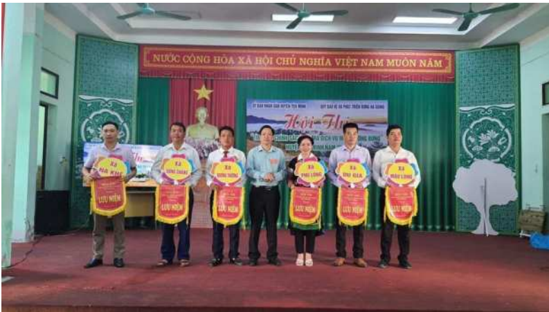
Hội thi "Tìm hiểu chính sách chi trả dịch vụ môi trường rừng" huyện Yên Minh năm 2023

Trung ương Đảng về tăng cường sự lãnh đạo của Đảng đối với công tác quản lý, bảo vệ và phát triển rừng.