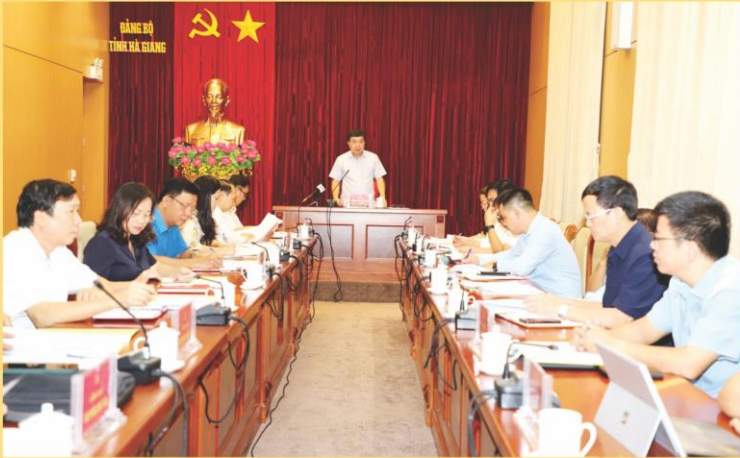
Họp chuẩn bị các nội dung tổ chức Hội nghị văn hóa năm 2023.