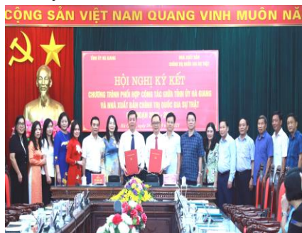
Hội nghị ký kết chương trình phối hợp giữa Tỉnh ủy Hà Giang và Nhà xuất bản Chính trị Quốc gia Sự thật

Theo đó, nội dung phối hợp tập trung vào 3 nội dung trọng tâm gồm: Tăng cường công tác tuyên truyền, quảng bá về vùng đất, con người tỉnh Hà Giang; kết quả thực hiện chủ trương, đường lối của Đảng, chính sách, pháp luật của Nhà nước và những thành tựu nổi bật đạt được trong công tác xây dựng Đảng, xây dựng hệ thống chính trị của Đảng bộ tỉnh Hà Giang. Thực hiện đề án trang bị sách cho cơ sở xã, phường, thị trấn trên địa bàn tỉnh Hà Giang. Tổ chức các hoạt động nghiên cứu, biên soạn, xuất bản và phát hành sách, tài liệu lý luận, chính trị.