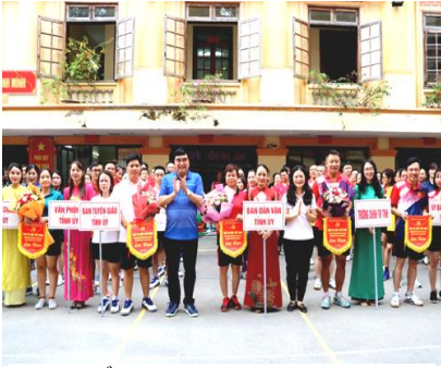
Ban Tổ chức trao Cờ lưu niệm cho các đơn vị

Giải thi đấu thể thao có sự góp mặt của hơn 100 vận động viên, tham gia thi đấu ở 4 môn gồm: Kéo co, bóng chuyền hơi, cầu lông, bóng bàn. Các vận động viên thi đấu ở các nội dung: Đôi nam; đôi nữ; đôi nam, nữ phối hợp theo hình thức chia bảng, thi đấu vòng tròn một lượt tính điểm. Ngay sau phần khai mạc, các vận động viên đã bước