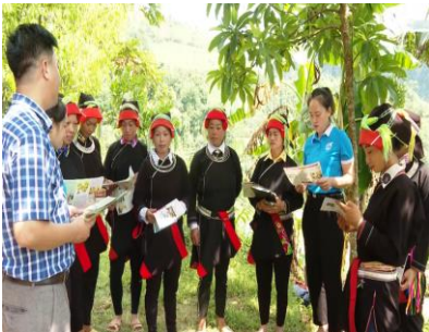
Phát tờ rơi tuyên truyền pháp luật tại cơ sở

Theo đó, nội dung, hình thức phổ biến, giáo dục pháp luật được các cấp, các ngành, cơ quan, đơn vị đổi mới theo hướng trọng tâm, ngắn gọn, dễ hiểu, phù hợp với đối tượng tiếp nhận. Đồng thời, triển khai thực hiện với nhiều hình thức phong phú, như: Lòng ghép với các đợt sinh hoạt chính trị, họp cơ quan, họp thôn, tổ dân phố, sinh hoạt “Ngày pháp luật”, thông qua lễ hội truyền thống các dân tộc; xây dựng chuyên mục, chuyên trang truyền thanh, truyền hình bằng tiếng dân tộc thiểu số; biên soạn các tài liệu, đề cương, tờ gấp, tờ rơi; gắn phổ biến, giáo dục pháp luật, với công tác xây dựng, thi hành và bảo vệ pháp luật. Kết quả toàn tỉnh đã tổ chức được 59.441 cuộc tuyên truyền phổ biến, giáo dục pháp luật, thu hút được trên 4.825.600 lượt cán bộ, đảng viên, công chức, viên chức và Nhân dân tham gia. Biên soạn, phát hành hơn 1.521.923 tài liệu, đề cương, trong đó có 76.749 tài liệu bằng tiếng dân tộc thiểu số; in trên 200.000 tờ rơi, 350.720 tờ gấp các loại; cấp phát trên 60 loại đĩa CD có nội dung phổ biến giáo dục pháp luật. Phát hành 5.000 bản tin Tư pháp; đăng tải, phát sóng gần 2.000 tin, bài, phóng sự, treo hơn 3.000 băng zôn, 2.000 cụm pa nô và tổ chức được 4.000 buổi chiếu phim lưu động về tuyên truyền pháp luật. Đồng thời, tổ chức 633 cuộc thi tìm hiểu pháp luật tại các cấp, các ngành, đơn vị, địa phương, thu hút trên 156.000 lượt người tham gia. Qua đó, tạo sự chuyển biến mạnh mẽ về nhận thức và ý thức tuân thủ, chấp hành pháp luật.