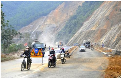
Dự án nâng cấp, mở rộng quốc lộ 2, đoạn đầu cầu Mè (thành phố Hà Giang)

Hội nghị đánh giá, trong nửa nhiệm kỳ vừa qua, tình hình thế giới và khu vực có nhiều diễn biến nhanh, phức tạp, khó lường; khó khăn, thách thức mới xuất hiện, gay gắt, nặng nề hơn dự báo. Thách thức an ninh truyền thống, phi truyền thống, biến đổi khí hậu, thiên tai, động đất... Bằng sự nỗ lực của toàn Đảng bộ, sự đoàn kết, thống nhất, quyết tâm chính trị cao, tỉnh ta đã cơ bản thực hiện thắng lợi mục tiêu, nhiệm vụ đề ra. Để thực hiện thắng lợi Nghị quyết Đại hội Đảng bộ tỉnh khóa XVII, Tỉnh ủy Hà Giang đã ban hành 33 nghị quyết, 28 chỉ thị, 44 chương trình, 23 đề án và nhiều kế hoạch để cụ thể hóa thực hiện thắng lợi các mục tiêu, nhiệm vụ Nghị quyết Đại hội đề ra. Trong đó tập trung đẩy mạnh thực hiện “3 đột phá”, “5 nhiệm vụ trọng tâm”. Qua triển khai thực hiện “3 đột phá” đã đạt được một số kết quả tích cực, khả quan: